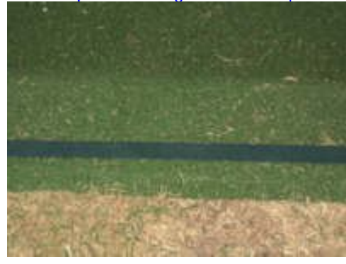
Cordolo protetto da gomma e moquette 4

E MENTRE A PALAU PENSANO AI BAMBINI "LORSIGNORI & LORSINGNORE/INE" PENSANO A SE STESSI ! E SI AUMENTANO GLI STIPENDI AL MASSIMO DI LEGGE. Alla faccia dei "sudditi" grandi e piccini !