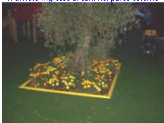
Aiuole ben curate, fondo in gomma + moquette