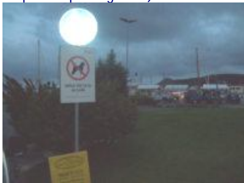
Il divieto ingresso ai cani nel parco esterno

Ieri sera, cedendo alle insistenze di mia figlia, assieme a mia moglie, l'abbiamo accompagnata al Parco Giochi di Palau e, con gli occhi sgranati, abbiamo ammirato quanto gli amministratori comunali palaesì, al quale, da padre ed ex Maestro, va il mio plauso per la loro sensibilità e rispetto per i propri piccoli Cittadini , siano avanti rispetto ai nostri troppo impegnati ad aprire cancelli di parcheggi condominiali che a pensare ai loro piccoli sudditi . Non aggiungo nessun altro commento (perché sarei troppo pesante e non voglio beccarmi una stupida querela per ingiurie ) e lascio al vostro giudizio ogni ulteriore commento. F. Vittello