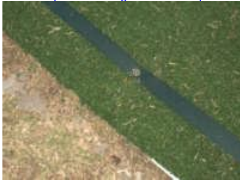
Cordolo protetto da gomma e moquette 3