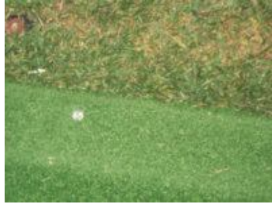
Cordolo protetto da gomma e moquette 2