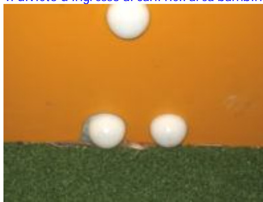
Particolare di un gioco. Dadi e perni protetti.