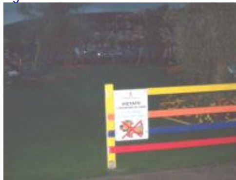
Il divieto d'ingresso ai cani nell'area bambini